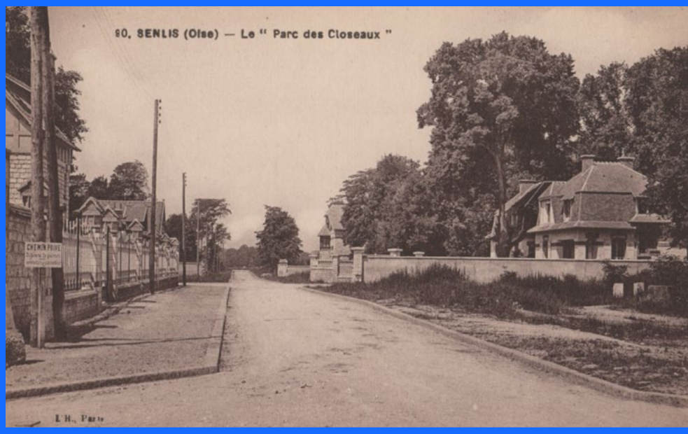
Le Parc des Closeaux