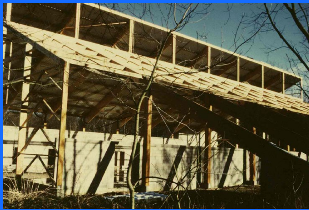
Construction du Gymnase de Brichebay en 1988