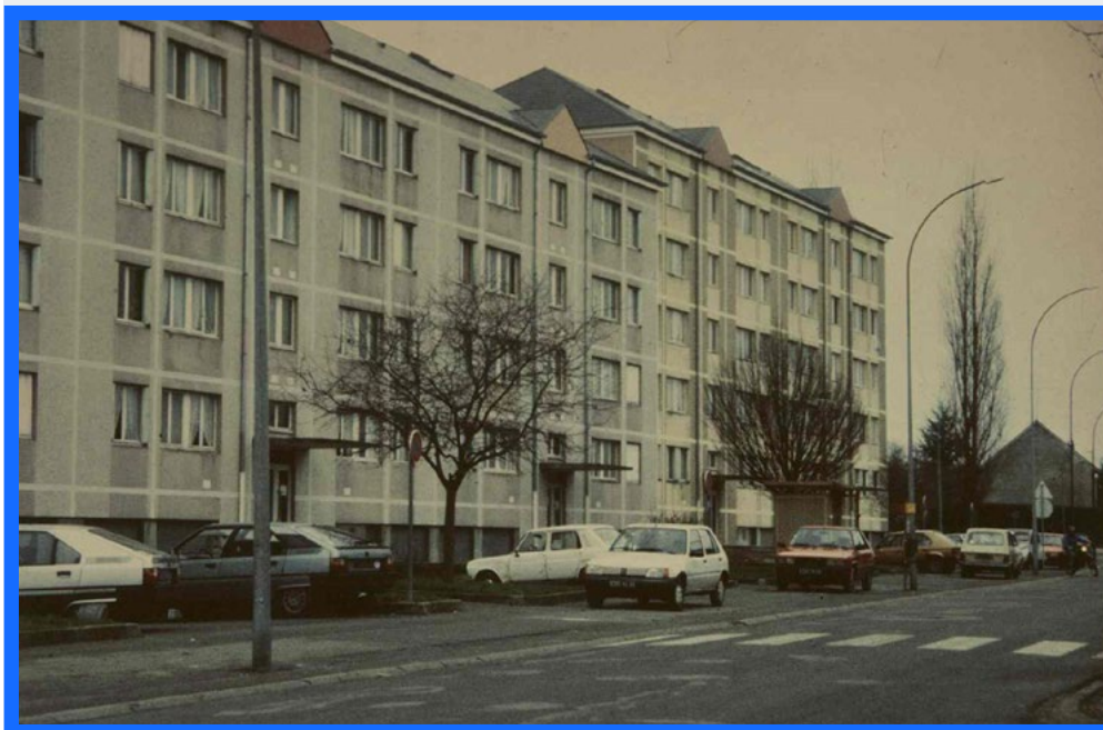
Immeuble de la rue Notre-Dame du Bon-Secours