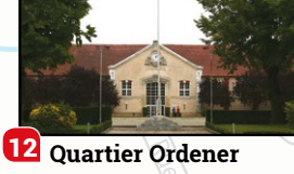
12 Quartier Ordener

En avant-première et en ouverture du Festival de Théâtre