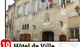
10 Hôtel de Ville