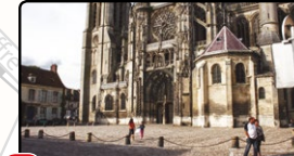
7 Cathédrale Notre-Dame