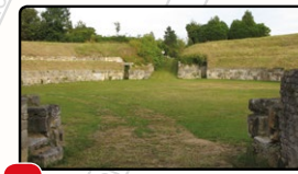
6 Arènes gallo-romaines