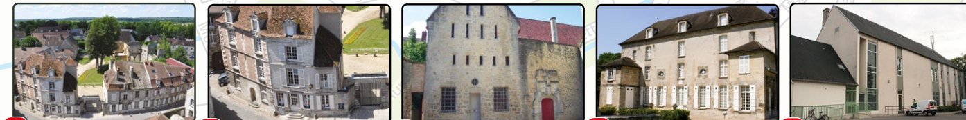
1 Parc du Château Royal 2 Office de tourisme 3 Prieuré Saint-Maurice 4 Musée de la Vénérie 5 Salle de l'Obélisque (en cas de pluie)