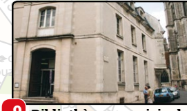
9 Bibliothèque municipale