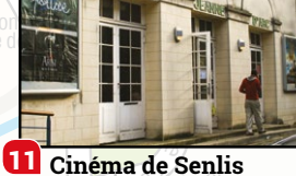
11 Cinéma de Senlis