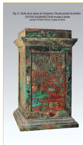
Fig. 9 - Socle de la statue de l'empereur Claude portant la mention CIVITAS SULBANECTIUM trouvée à Senlis

Renseignements / adhésions : contact@archeologie-senlis.org