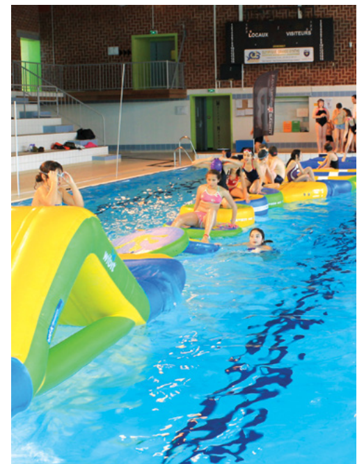
« Water Spin »