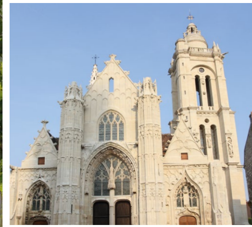
Ancienne église Saint-Pierre