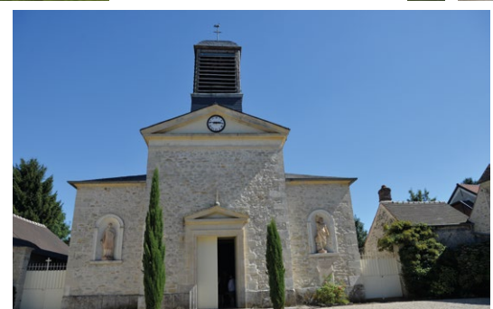
Église de Fontaine-Chaalis