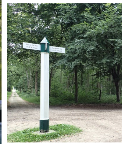
Poteau forestier, forêt d'Emmenonville