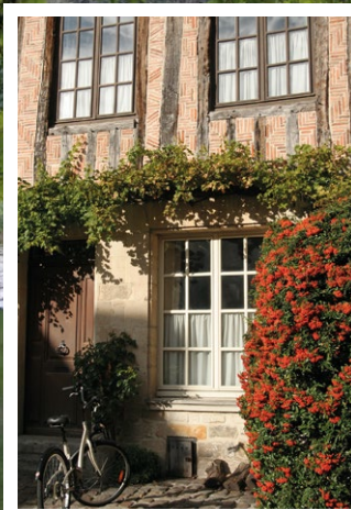
Centre ancien de Senlis