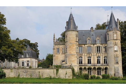
Château de Mont-l'Évêque