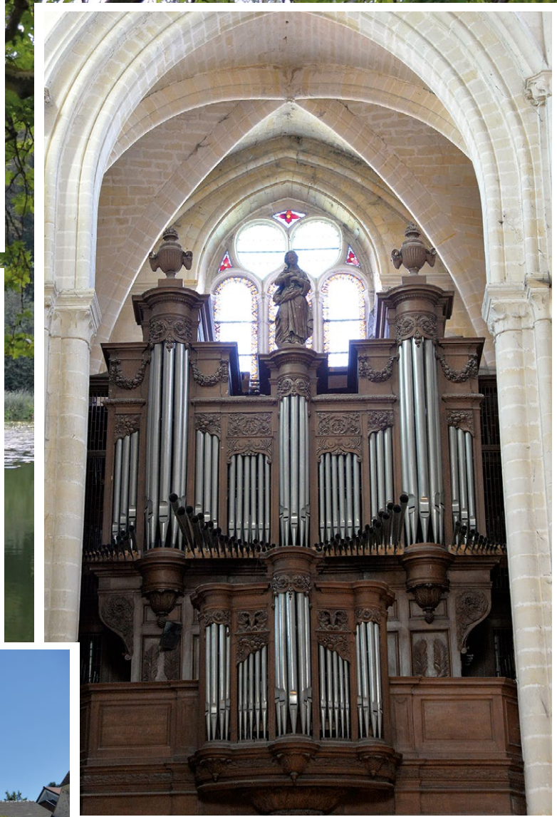
Orgues de la cathédrale Notre-dame de Senlis